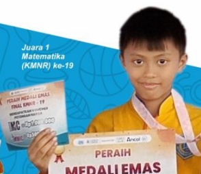
Juara 1 Matematika (KMNR) ke-19