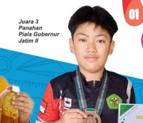
Juara 3 Panahan Piala Gubernur Jatim II