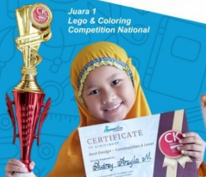
Juara 1 Lego & Coloring Competition National