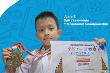
Juara 2 Bali Taekwondo International Championship